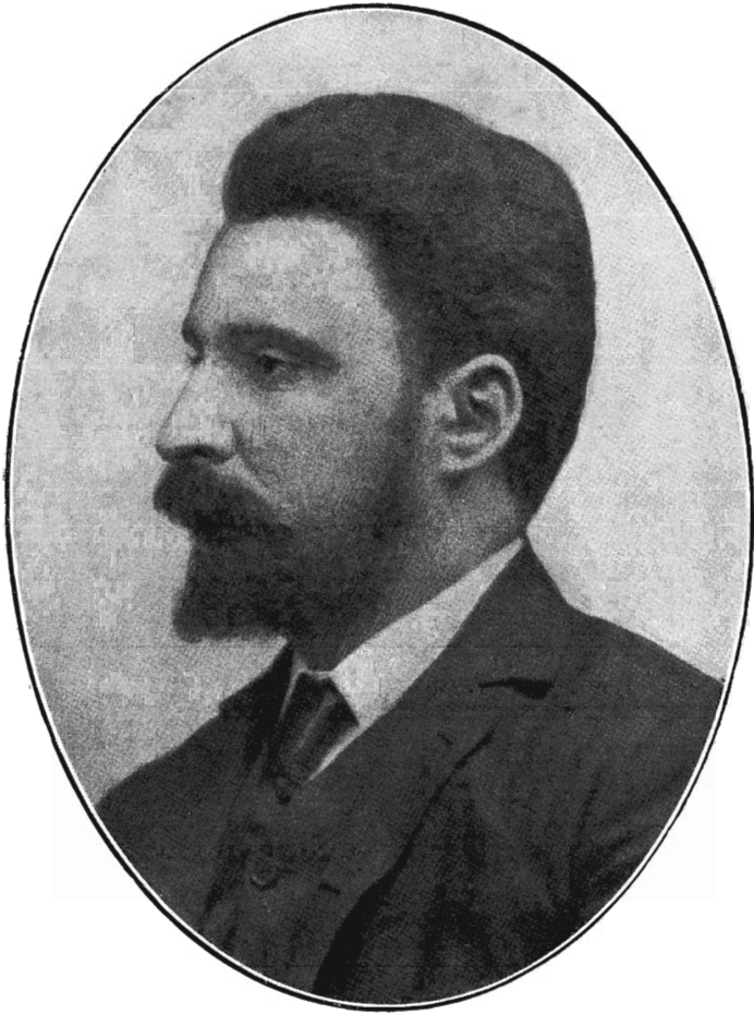
VINTILĂ I. C. BRĂTIANU